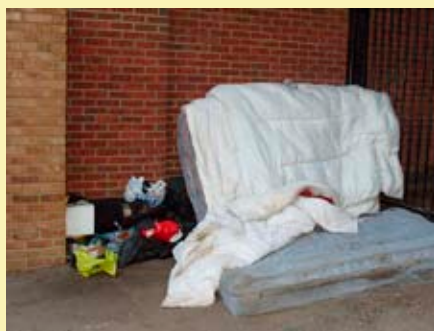
Lugar de descanso de inmigrantes polacos sin techo, UK

El programa de reconexión es el primero que lleva a cabo BARKA Reino Unido en cooperación con los distritos londinenses de Ham-