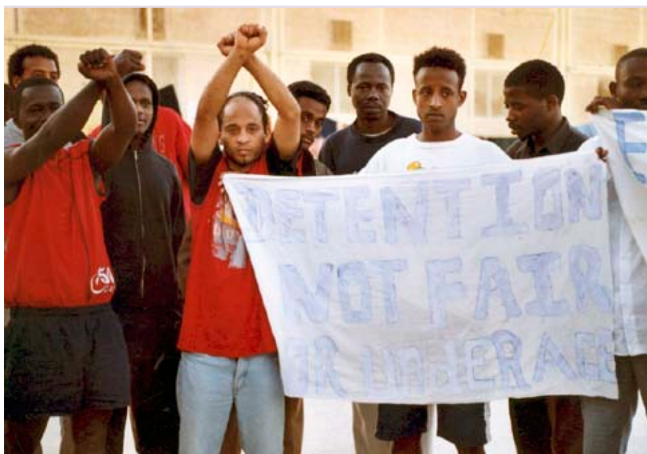
Detención (Isla de Malta, Centro de Detención de Inmigrantes HAL FAR)