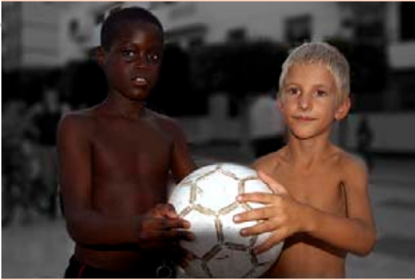
Un niño senegalés y otro lituano jugando al fútbol en, Almería, España