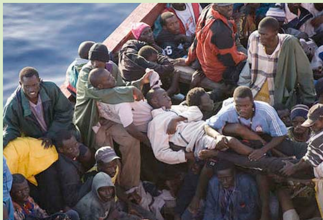
Llegada de un cayuco con 229 inmigrantes africanos a bordo en el Puerto de los Cristianos en la isla de Tenerife

A nivel nacional, la inmigración es responsabilidad del Ministerio de Trabajo e Inmigración. Todos los miembros de EAPN y otros actores sociales le han estado dirigiendo propuestas para que la regularización posterior al decre-