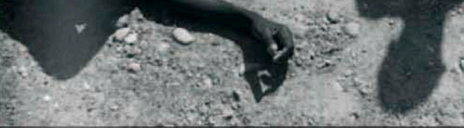
Konvoji maseküllü a Kander-sajgetek patjün