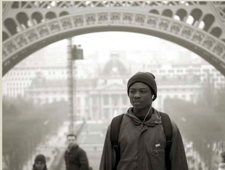
Retrato de un vendedor "ilegal", París

tema común. En lo que se refiere al mercado laboral hay que simplificar el sistema de reconocimiento de las cualificaciones profesionales, y también es necesario revisar la lista de los empleos restringidos en los sectores público y privado. La lucha contra la discriminación legal es un requisito previo a la supresión de las demás formas de discriminación. En vivienda, está clara la insuficiencia del parque de viviendas públicas en alquiler.