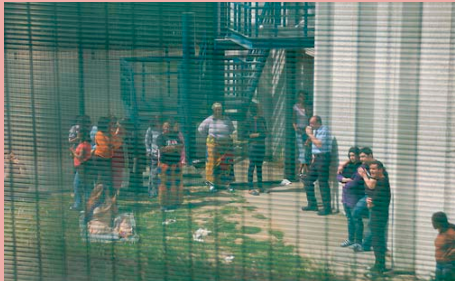
Centro de Detención 127bis en Bélgica

Tanto las ONG que actúan en este campo, como las investigaciones académicas al respecto demuestran que los movimientos migratorios casi nunca están motivados por el mero deseo de mejorar la situación económica, sino que, en la mayoría de los casos, es la única opción para poder escapar de la pobre-