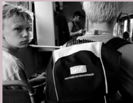
"Svenska för invandrare - Sueco para inmigrantes"

Las organizaciones de inmigrantes y las "suecas" no reciben la misma cantidad de recur-