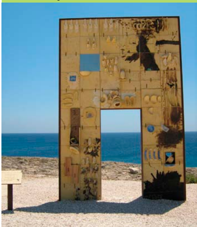
Lampedusa (Italia), escultura de Mimmo Paladino dedicada a todos los inmigrantes que murieron intentando llegar a las costas europeas.

menos 30 personas han sido detenidas por dar asistencia a inmigrantes sin papeles desde 1986. La mayoría de estos casos fue de personas que cedieron alojamiento 4 . En 2007 la organización greco-chipriota KISA fue llevada a los tribunales por reunir dinero para pagar una operación a vida o muerte de un inmigrante 5 . La protección social y el proceso de inclusión social de la UE puede desafiar la idea de que algunos grupos de población no merecen protección social básica por su situación irregular. Por de pronto los más vulnerables de Europa han sufrido la segregación por causa de su estatus administrativo. Por tanto, el proceso de inclusión y protección sociales no sólo se han frustrado, sino que corre el riesgo de crear un 'Cuarto Mundo' más dividido, más marginado y más fácil de explotar en el seno de la sociedad europea.