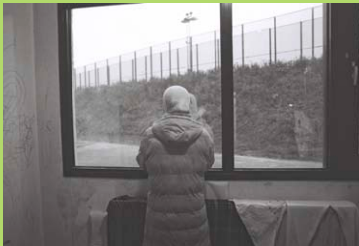
Mujer a punto de ser expulsada, centro de detención 127bis, Bélgica.

Para abordar la inmigración irregular muchos Estados miembro han recurrido a limitar los principales elementos de la inclusión social, principalmente la salud, la vivienda y un salario digno para su grupo de inmigrantes más vulnerables. Las barreras legales y prácticas contra el acceso de los inmigrantes a sus derechos tienen la clara intención de llevarles a una situación de indigencia tan intolerable que les obligue a salir de Europa. Estas políticas, no sólo carecen de efectividad a la hora de frenar la inmigración irregular sino que significan una importante amenaza a la cohesión social y las estrategias de sanidad pública, y corren el riesgo de degradar las condiciones laborales en Europa. Más aún: inciden de forma desproporcionada en grupos vulnerables de sin papeles, entre los cuales hay mujeres, niños y enfermos que necesitan tratamiento médico urgente. En lugar de apoyar a la sociedad civil en su lucha contra esta forma extrema de pobreza en Europa, algunos Estados miembro llegan a criminalizar a las organizaciones y personas que ayudan a los sin papeles, alivian su sufrimiento o buscan garantizarles un nivel mínimo de dignidad humana. En Francia, al